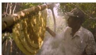
À Segré, le 23 novembre : « Une terre sans abeilles »