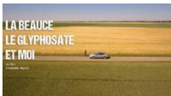
À La Poëize, le 10 ou 17 novembre : « La Beuce, le glyphosate et moi »

Toujours dans l'esprit du Festival, ils vont maintenant préparer les soirées avec des intervenants qui assureront les débats avec les participants.