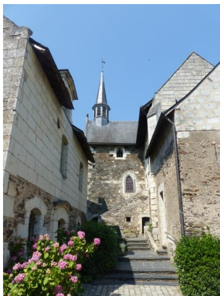
Sanctuaire de Béhuard

TROIS GROUPES DE MARCHEURS vont converger vers Notre-Dame-du-Marillais et se retrouver le dimanche 4 septembre matin.