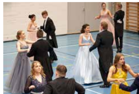
↑ Le bal des 2 e année.