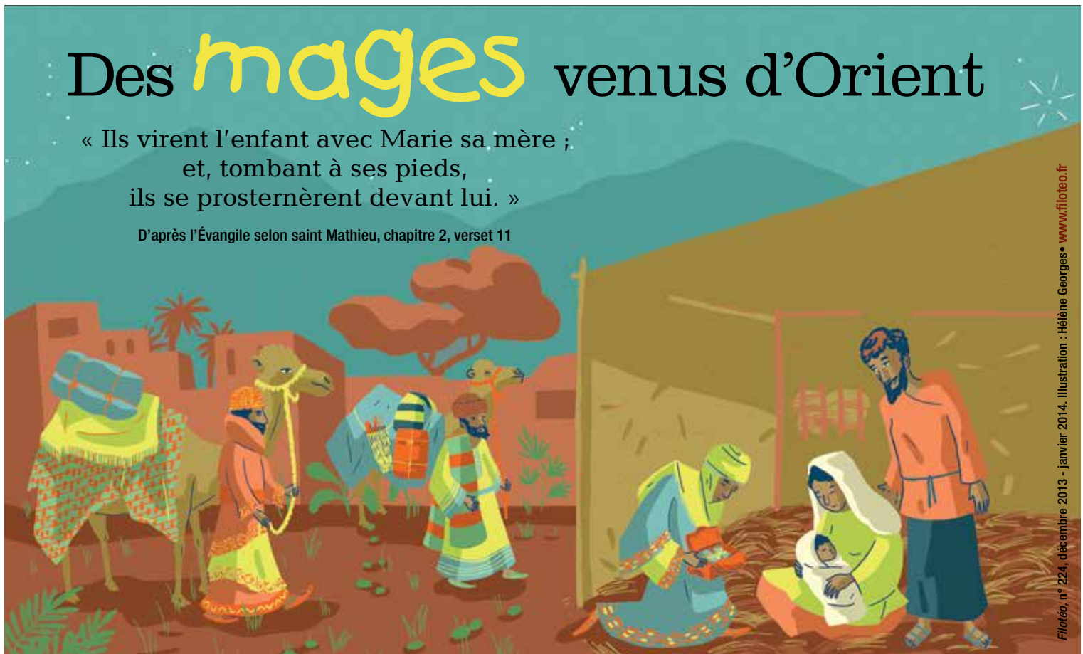
Filatéa, n° 224, décembre 2013 - janvier 2014. Illustration : Hélène Georges • www.filatea.fr

D'après l'Évangile selon saint Matthieu, chapitre 2, verset 11