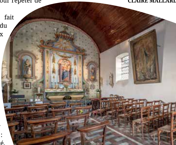
La crèche de l'église de Roussay.