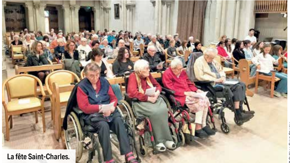
La fête Saint-Charles.

Durant la célébration, les chants, les lectures et les sourires se sont mêlés pour rappeler que la vie est belle quand elle se partage avec les autres. Nous avons pris le temps de remercier Dieu pour tout ce qu'il nous offre. Plusieurs résidents