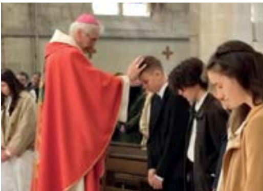
Dimanche 26 octobre à Doué-la-Fontaine, célébration de la confirmation pour dix jeunes de nos paroisses, en présence de Mgr Delmas.