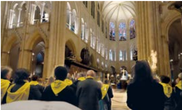
Pèlerinage à Paris, sur les pas de saint Denis, pour une cinquantaine de paroissiens de St-Denis et St-Martin, les 18-19 octobre : messe à Notre-Dame, visite de la basilique St-Denis, nuit et prière à Montmartre.