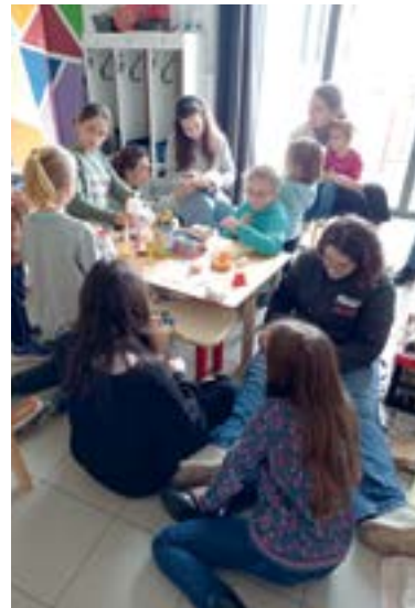
Lancement des équipes de l'Action catholique des enfants (ACE) à Montreuil-Bellay et à Champ-sur-Layon.