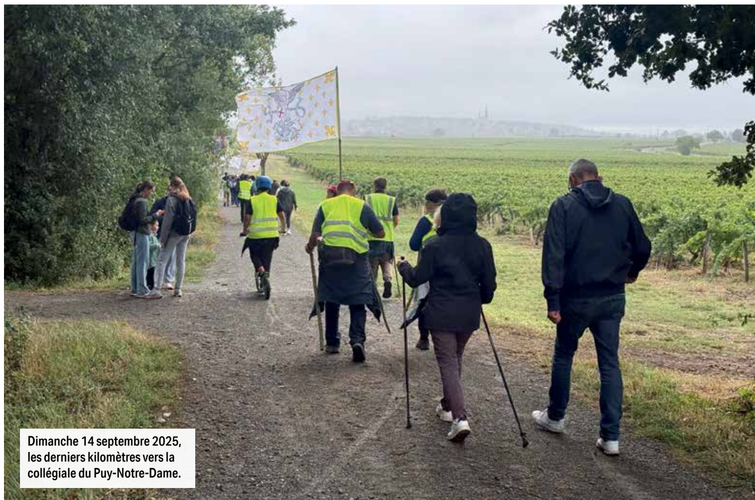
Dimanche 14 septembre 2025, les derniers kilomètres vers la collégiale du Puy-Notre-Dame.

Selon les charismes, chacun y trouvera un appel à la simple contemplation d'une belle journée d'automne ou à la méditation, en longeant les rangs de vignes au Puy-Notre-Dame, qui nous rappellent les paroles du Christ: « Moi, je suis la vigne, et vous, les sarments. Celui qui demeure en moi et en qui je demeure, celui-là porte beaucoup de fruit, car, en dehors de moi, vous ne pouvez rien faire » (Évangile selon saint Jean).