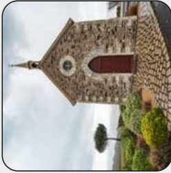
Chapelle des Galloires, Drain, Orée d'Anjou