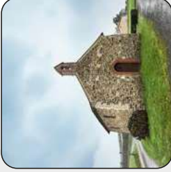
Chapelle de Sainte Avoye, Saint Rémy en Mauuges, Montrevault sur Evre