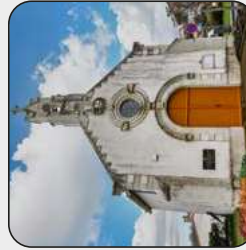
Chapelle Sainte-Apolline, Place Sainte-Apolline, Drain, Orée d'Anjou