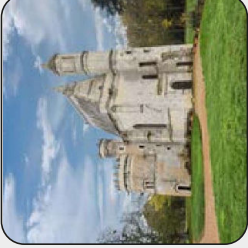
Chapelle du château de la Bourgonnière, Bouzillé, Orée d'Anjou