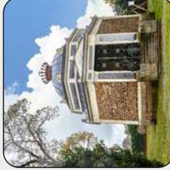
Chapelle de L'Enfeu Sainte-Sophie, Bouzillé, Orée d'Anjou