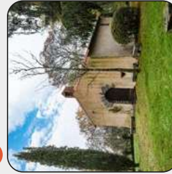
Chapelle de Beaulieu, Liré, Orée d'Anjou